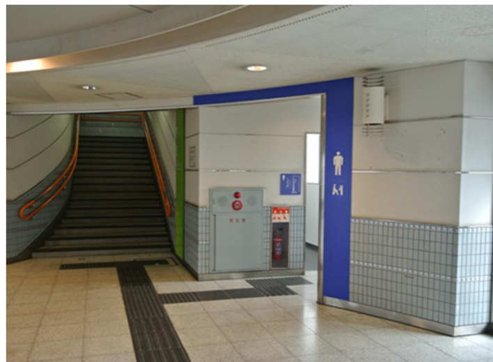
トイレ入口のサインはわかりやすく大型化して視認性を向上させている。トイレ内の設備も表示している。