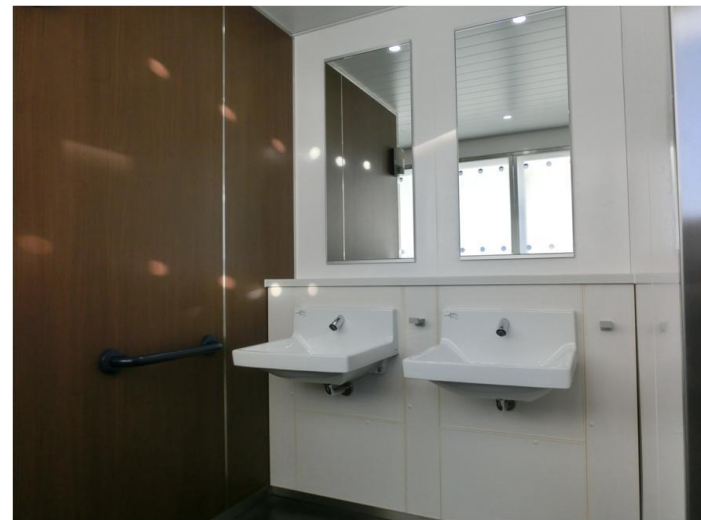
既設のカウンタータイプから壁掛ハイバック洗面器への改修により省スペース化、洗面まわりの動作空間を確保している。洗面器横には傘などをかけるフックを設置。