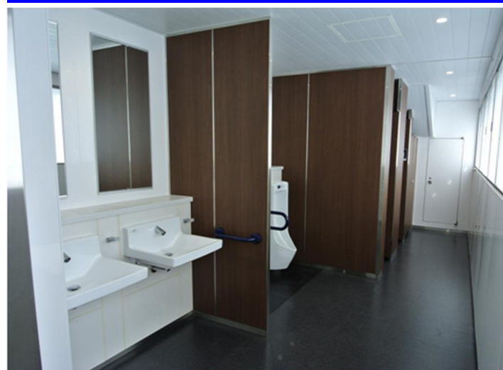
白と濃い木目柄を基調として、落ち着いた空間を演出している。照明はLEDダウンライトを採用。