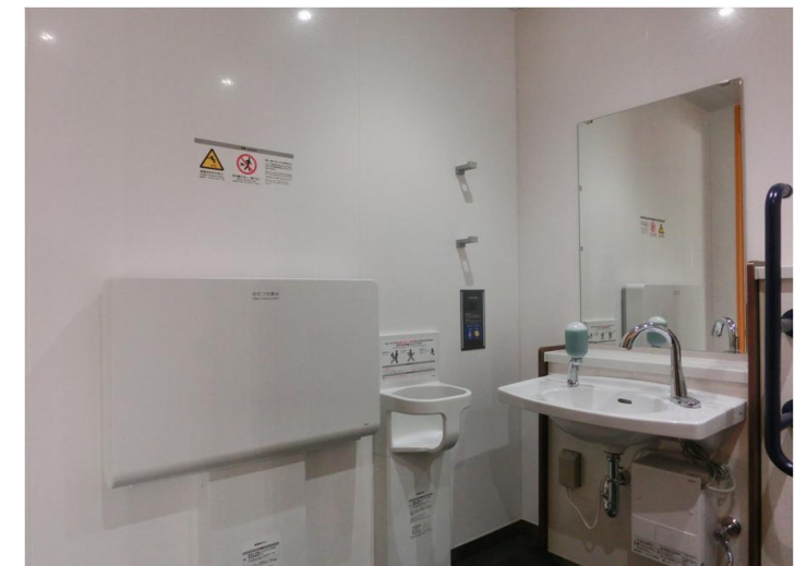
ベビーシート、ベビーチェア、フックも完備しており、小さなお子様連れの方などにも配慮している。