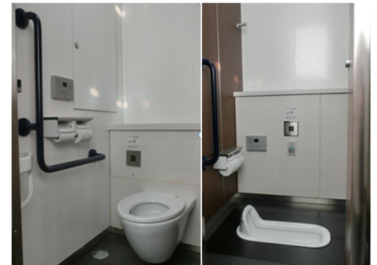
床の清掃性に優れた壁掛式大便器と洗浄はセンサースイッチ、音姫(擬音装置)を採用。男女トイレ共に、1ヶ所ずつ和式便器を設置して便器まわりの床にはにおいや汚れを軽減するハイドロセラ・フロアを設置している。