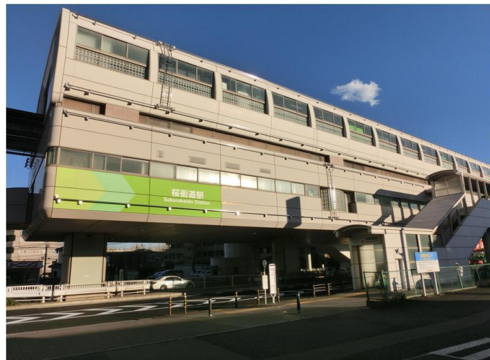
1998年に多摩都市モノレール線開通と同時に開業。相対式2面2線ホームをもつ高架駅。