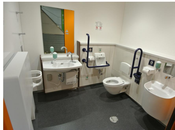
既設の多機能トイレスペースを拡張。車いす使用者やオストメイトの方など、さまざまな利用者に対応できる設備を完備。