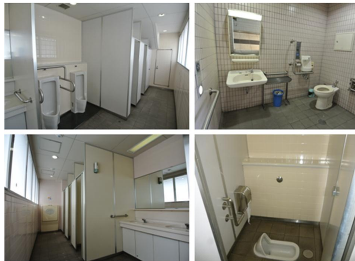
完成から16年経過し、より多くのお客様に快適に駅をご利用頂くために、トイレのリニューアルを行いイメージアップを図る検討を行った。